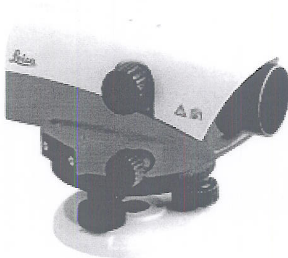
Общий вид нивелиров с компенсатором NA 720, NA 724, NA 728, NA 730

Пломбирование крепёжных винтов корпуса нивелиров с компенсатором NA 720, NA 724, NA 728, NA 730 не производится; ограничение доступа к узлам обеспечено конструкцией крепёжных винтов, которые могут быть сняты только при наличии специальных ключей.